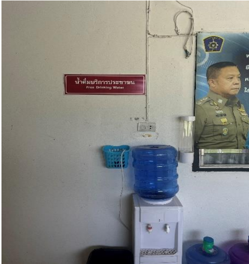
น้ำดื่มบริการประชาชน